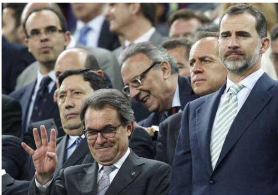
El Muy Impresentable hace su saludo cómplice a un amiguete junto al monarca.

La directiva del Barcelona había pedido respeto al Himno, pero también había advertido su incapacidad para imponer nada a sus aficionados porque no es el organizador de la final del Camp Nou. Por su parte el futbolista Xavi Hernández, charnego agradecido, pasa del “ que viva España ” en la plaza de Colón en Madrid al populismo más entusiasta cuando tras la vergonzante pitada afirmó que “ fue una pitada espectacular, pero estamos en democracia y todo el mundo puede opinar. Se debería valorar el porqué de los pitos y no sancionar ”. Imaginamos que si se marcha a jugar a seguir cubriéndose el riñón a un equipo del golfo pérsico no dirá lo mismo si algo parecido viera, a riesgo de perder la cabeza literalmente .