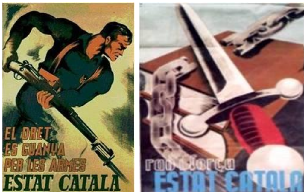
Carteles de la presunta República Catalana incitando al empleo de las armas contra el resto de los españoles.

Se han pervertido los símbolos, la historia real del condado de Barcelona, ocultando que Cataluña no existió jamás como estado independiente y la verdad sobre los perversos y negativos intentos de secesión más recientes, sobre las revueltas de 1640 8 y el corpus de sangre , y que por culpa de las propias autoridades catalanas España perdió los territorios ultrapirenaicos catalanes acusando cínicamente a España y Francia de ello en su nuevo imaginario, en el que hacen catalán incluso a Cristóbal Colón o a la propia Tartessos remontándose a una precataluña en el neolítico.