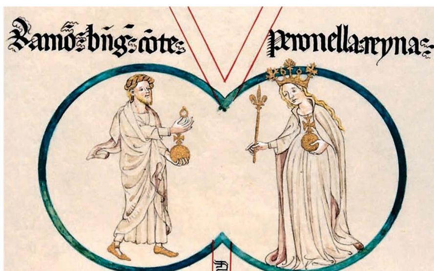
Ramón Berenguer Conde-Petronilla Reyna. Hay quienes al ver la imagen juzgan que la reina "Petronilla parece inclinarse con gesto de reverencia hacia el conde de Barcelona".