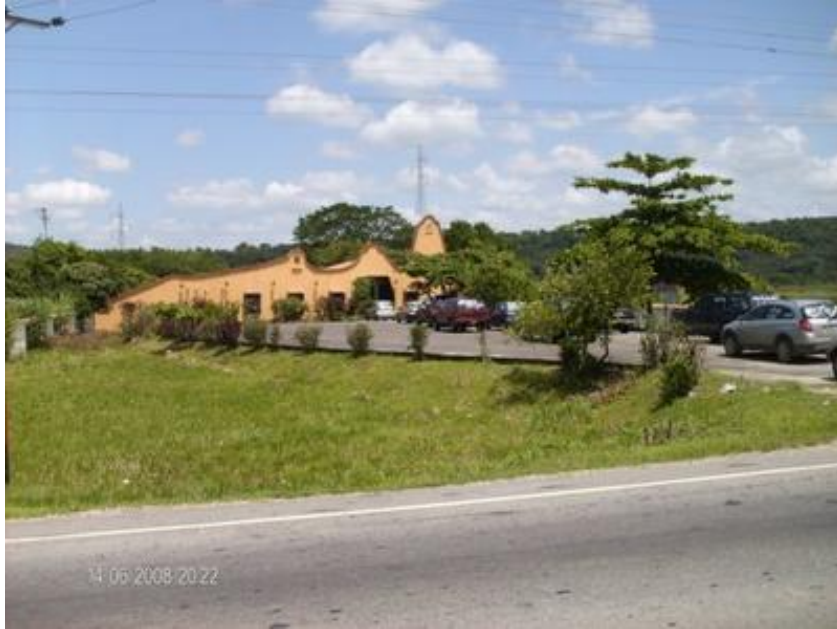
La Chavera en Barinas!! Latifundio Chavista de 320 Has, dueño: el humilde soldado que se sacrifica por su pueblo Hugo Golpista Chávez