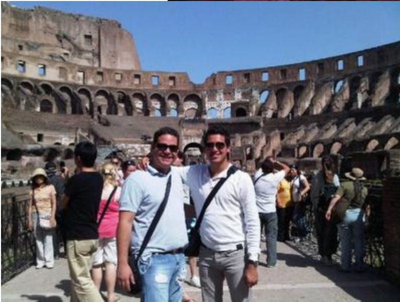
Paseando en Roma, los sobrinitos de Hugo

Otro sobrino de Hugo Chávez Frías en jet privado. Ahora toda la familia Chávez viajan en helicópteros y aviones del Estado Venezolano. Todos tienen inmunidad diplomática en sus pasaportes. Pagado por supuesto por el pueblo Venezolano que lo eligió a el democráticamente. Pero quiere imponer su voluntad para que todos seamos socialistas, comunistas y mandar al pueblo Venezolano a callar para que el quede en el poder y su familia viaje, gaste los dólares que no le dan a uno y beba Johnnie Walker Whisky- Black Label.. pero ser rico es malo