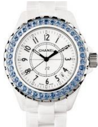
Clever Chávez comiendo Langosta a La Thermidor muy revolucionaria en Viña del mar Lobster House en Isla Margarita con su esposa quien tiene un reloj muy Capitalista Chanel J12 con diamantes cuestan de 12,000 a 15,000 Dólares.