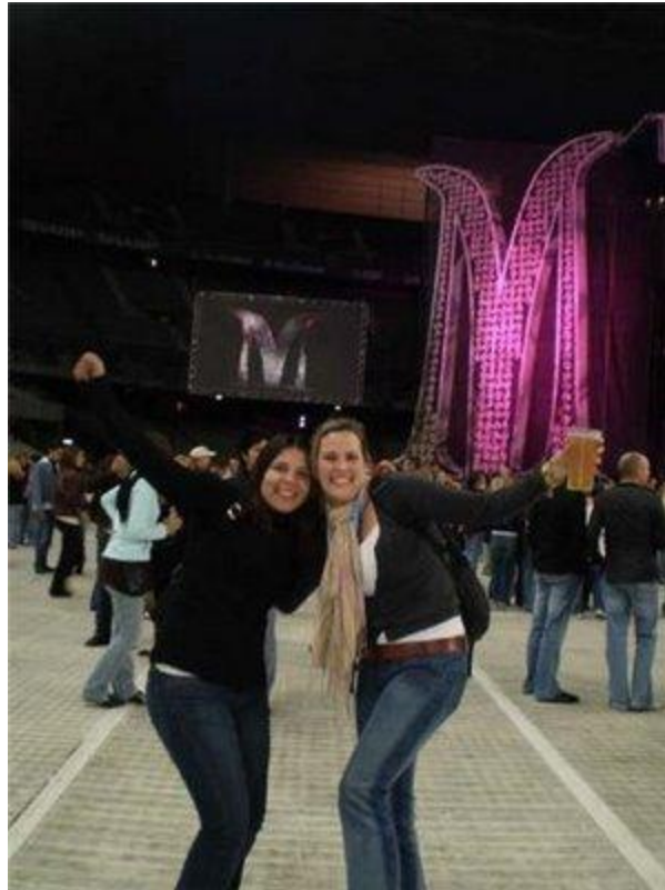
LA HIJA DE CHÁVEZ EN EL CONCIERTO DE MADONNA EN PARIS! UH AH SOCIALISMO YA! (CLARO ELLA FUE CON CUPO CADIVI, JAJAJA)