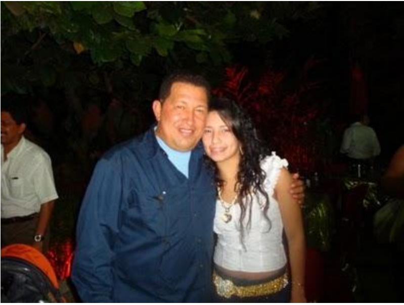
Karlita la consentida de Hugo