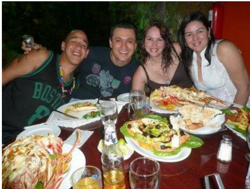
Que bueno!!! Langosta para los Chávez, y Cola de Mercal para el pueblo