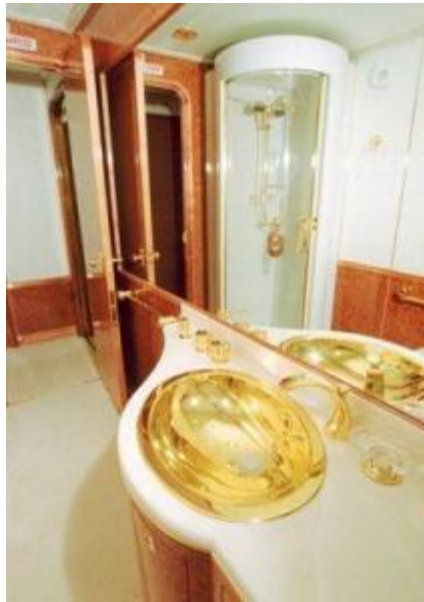
La camita y totuma en oro

Además, me imagino que para ese chancletúo, le habrán tenido que construir un escusado de hoyo especial que es lo único que sabrá usar porque de donde viene... ¡Y periódico de papel higiénico!.