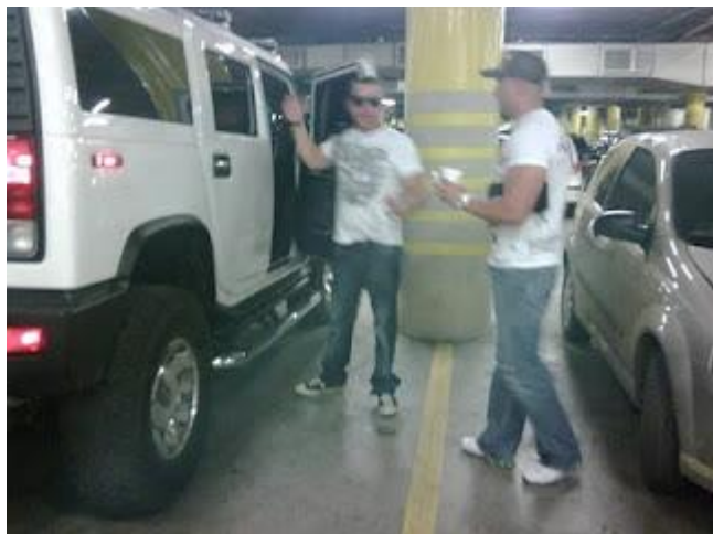
Los Chavez "la familia Real" paseando con sus Hummer ultimo modelo en Barinas.